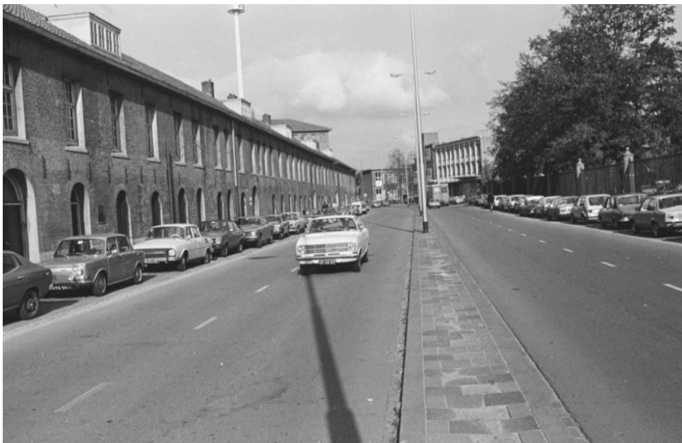
Afb. 2. De Keizerstraat: een aantrekkelijke entree van het Centrum?