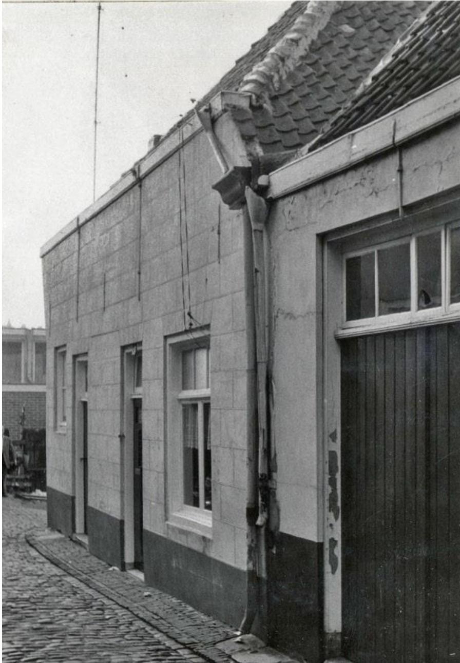
Afb. 7 en 8. Boven de Kleine Molenstraat, gezien vanuit de Molenstraat, vlak voor de afbraak van het gehele bouwblok. Rechts de boerderij van Feskens, rechts aan het eind van het straatje. Onder deze bebouwing werden bij opgravingen in 1982 13de eeuwse bouwsporen gevonden.