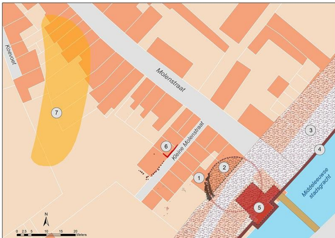
Afb. 6. De besproken sporen en structuren uit de 13de-15de eeuw op het kadastraal minuutplan van 1824.

Rond Breda werd rond 1260-1280 een gracht en een aarden verdedigingswal en een gracht, aansluiten op de Mark, aangelegd. De molenberg is vermoedelijk als een halfcirkelvormige heuvel iets later tegen de wal opgetrokken. Niet lang na de bouw van de stenen stadsmuur vanaf 1331 zal de molen in onbruik zijn geraakt. Misschien dat er een relatie ligt met de bouw van de Gevangentoren. (afb. 6)