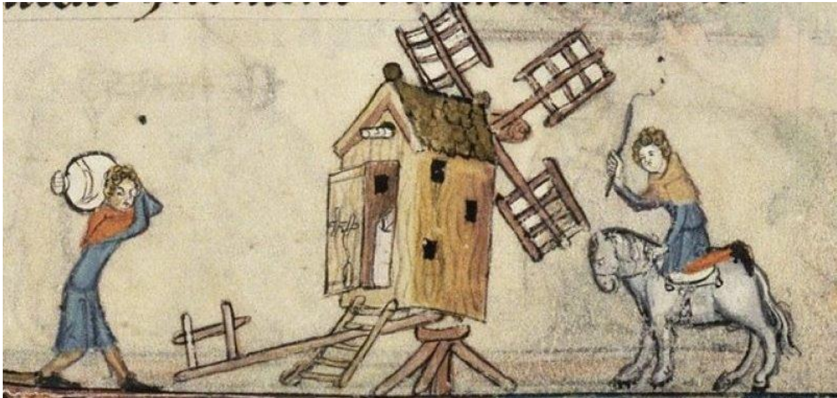
Afb. 1 Verluchting uit een Vlaams manuscript, de Alexanderroman. Deze illustratie stamt uit 1344 en laat een middeleeuwse standerdmolen zien.

Over de windmolen waaraan de Molenstraat zijn naam aan ontleend is uit historische bronnen bijzonder weinig bekend. In 1331 is er een eerste vermelding in de rolrekeningen waarin de kosten van de bouw van de stadsmuur worden beschreven. Daar is sprake aanvoer van bouwmaterialen van der wintmolen te voren aen die veste. In 1364 is er alleen nog sprake van een “molenberghe” en in 1415 van een “molenwerf”. De Heren van Breda zullen ongetwijfeld de initiatiefnemers van de bouw zijn geweest, immers zij bezaten het molenrecht en hebben dat in Breda rigoureuus toegepast. Het type windmolen waar we hier mee te maken hebben is de standerdmolen (afb 1). Bij deze molen kon het hele huis, en dus ook de wieken en het maalmechanisme ronddraaien rond een zware houten spil.