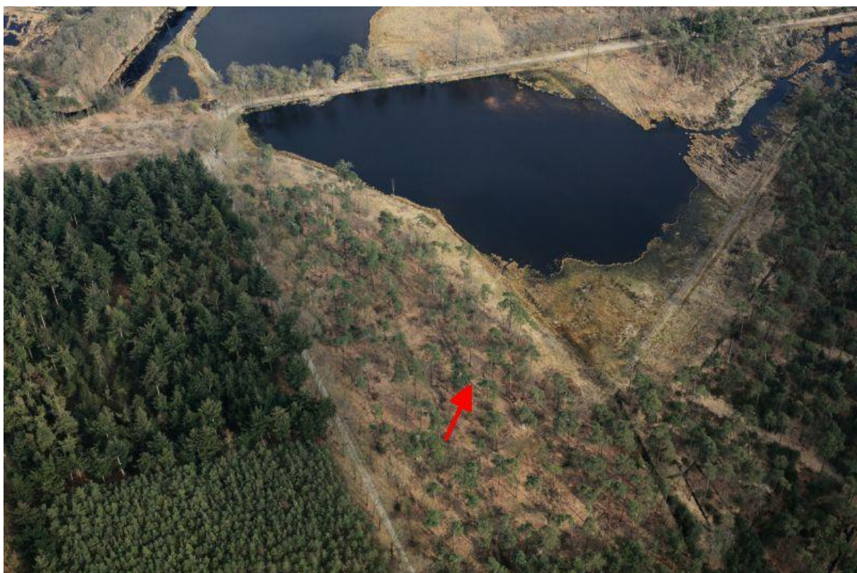
Een luchtfoto met beide vennen en een aanduiding waar de baan ooit lag.