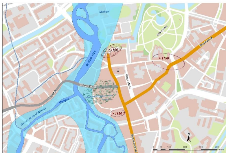
Figuur 1 Ligging van de oudste nederzettingkernen en de veronderstelde infrastructuur

Indien de Aa ook de Mark kan zijn, moeten we dan niet eens nagaan of er meerdere locaties mogelijk zijn en waarbij de naamgeving "Brede Aa" logischer is? De resultaten van het archeologisch onderzoek dat tussen 1983 en 1997 in de nabijheid van de Mark werd uitgevoerd kan een andere licht op de naamgeving werpen. Met dit in het achterhoofd zijn bij de "Brede Aa" een aantal kanttekeningen te maken.